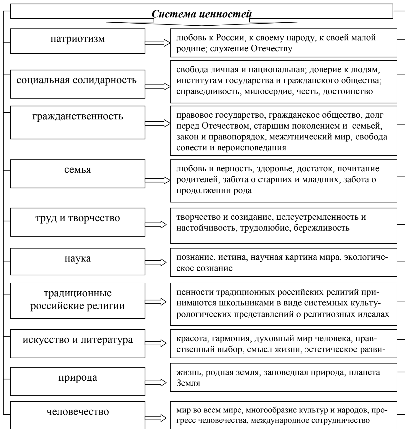
Рис. 7. Система ценностей в МКОУ «Леоновская основная общеобразовательная школа».

По сути, формирование личности гражданина и патриота России обосновывается моделью выпускника.